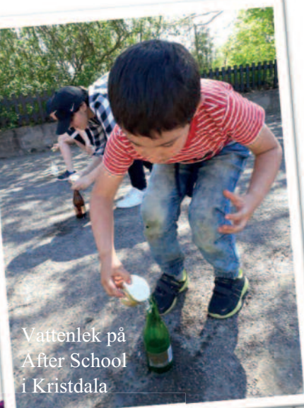
Vattenlek på After School i Kristdala