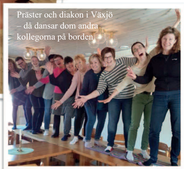
Präster och diakon i Växjö – då dansar dom andra kollegorna på borden