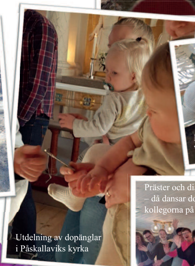
Utdelning av dopänglar i Påskallaviks kyrka