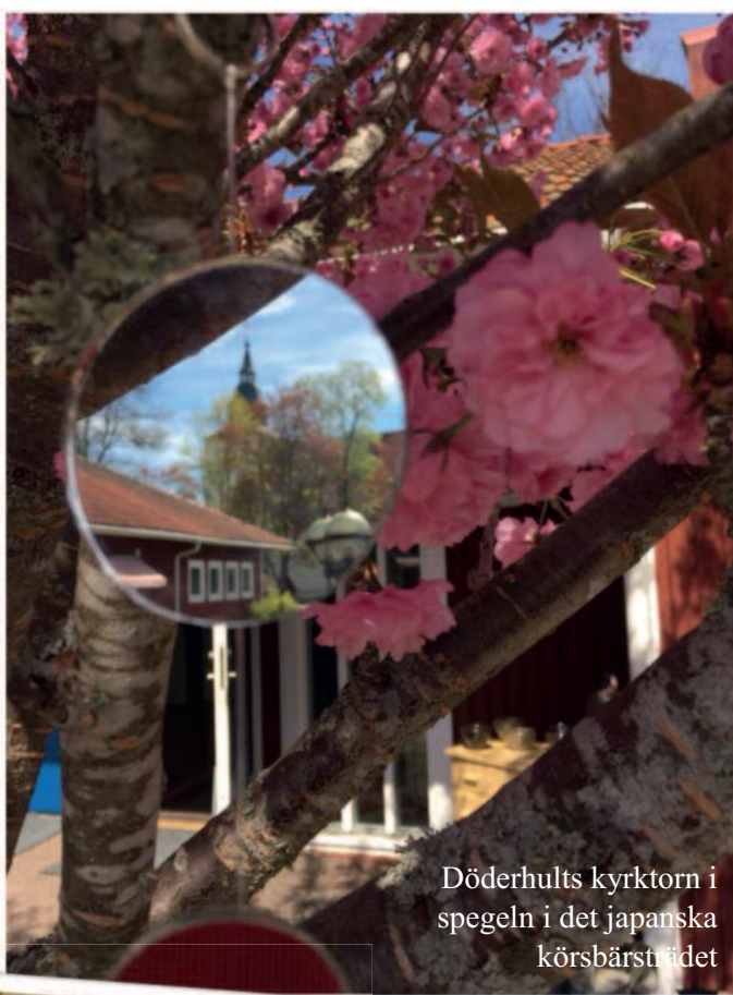
Döderhults kyrktorn i spegeln i det japanska körsbärsträdet